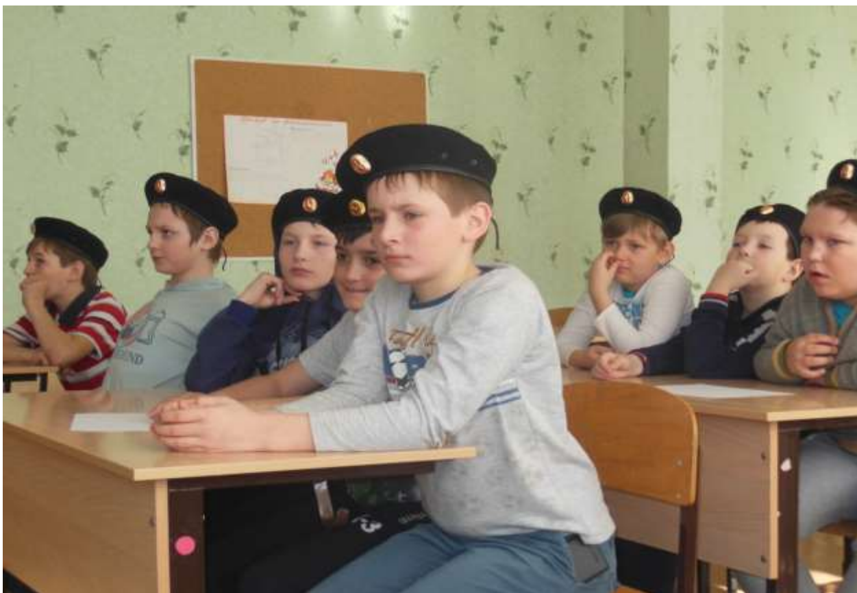
Топографическое ориентирование. Работа с топографическими картами