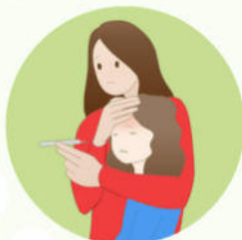
Уход за больным