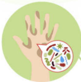
Контакт с загрязненными поверхностями