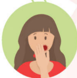
Прикосновение к лицу, особенно к глазам, носу, рту